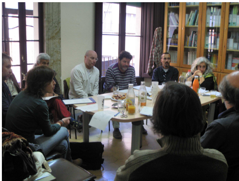
Imatge 1: Assemblea General d'EdC celebrada el 28 de maig de 2011

A l'Assemblea General celebrada el 28 de maig de 2011 a Figueres, al local de la IAEDEN, es va compartir les respostes rebudes al qüestionari (veure annex 2) i es va aprofitar per aprofundir en la situació de l'entitat, fent una reflexió conjunta i aportant també la seva visió les entitats que no havien respost el qüestionari amb antelació. En aquest espai de debat van participar una vintena de persones representants de set entitats membres de la Federació.